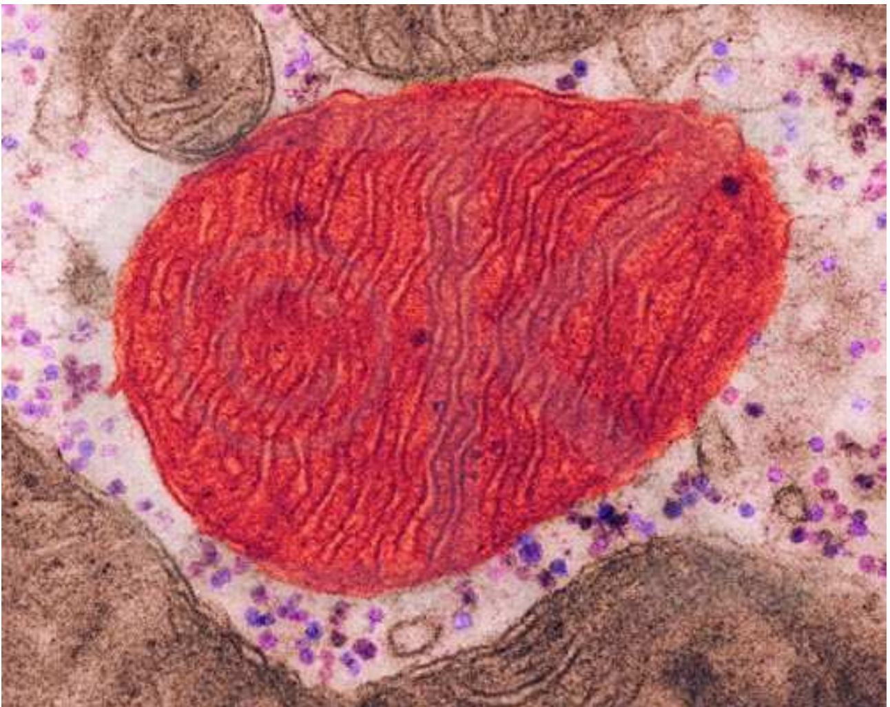
Mitocondrio di cellula muscolare (x 191000)