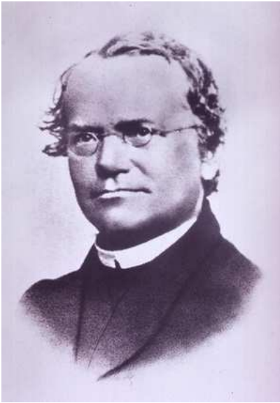
Gregor Mendel (fonte: U.S. National Library of Medicine)

Nel 1865 un monaco boemo, Gregor Mendel , pubblicò i risultati di varie sperimentazioni in un lavoro dal titolo " Esperimenti sull'ibridazione delle piante ". Questi studi, condotti nell'arco di otto anni, permisero di formulare le leggi che stanno alla base dell'ereditarietà. Ai tempi di Mendel non si sapeva ancora niente dei cromosomi ed era radicata la convinzione che i caratteri presenti nella progenie derivassero dal mescolamento di non ben specificate "essenze". Secondo il principio dell' ereditarietà per mescolamento , quei caratteri ritenuti vantaggiosi, in genere, da allevatori e agricoltori, venivano "diluiti" nelle generazioni successive, per apparire nella progenie a metà, successivamente ad un quarto e così via. Grazie agli studi quantitativi, condotti con metodo e determinazione, Mendel giunse alla conclusione che i caratteri ereditari fossero "discreti", cioè delle unità finite e distinte, proponendo quindi un modello di ereditarietà particolare . Solo successivamente a queste unità discrete fu assegnata la definizione che ancora oggi utilizziamo: i geni .